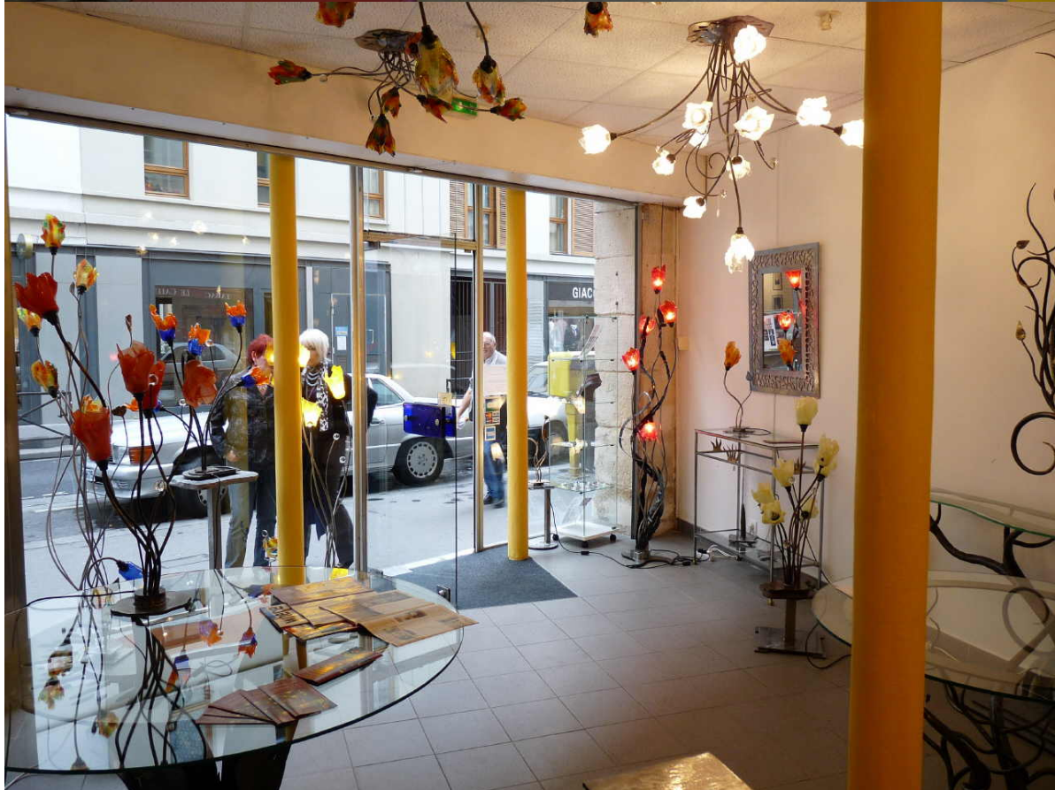
ORFER Paris : 129, rue de Charenton 75012, Paris.